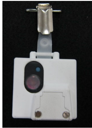
Abbildung 1: Lichtexpositionsmessgerät – ActTrust der Firma Condor Instruments

Die Lichtexposition wurde kontinuierlich, 24 Stunden lang, mit einem tragbaren Lichtexpositionsmessgerät (ActTrust, Firma Condor Instruments, Abbildung 1), über eine Arbeitswoche im Winter und im Frühling erhoben. Die Lichtexpositionsmessgeräte wurden vor dem Einsatz in der Feldstudie im Optiklabor der BAuA kalibriert.